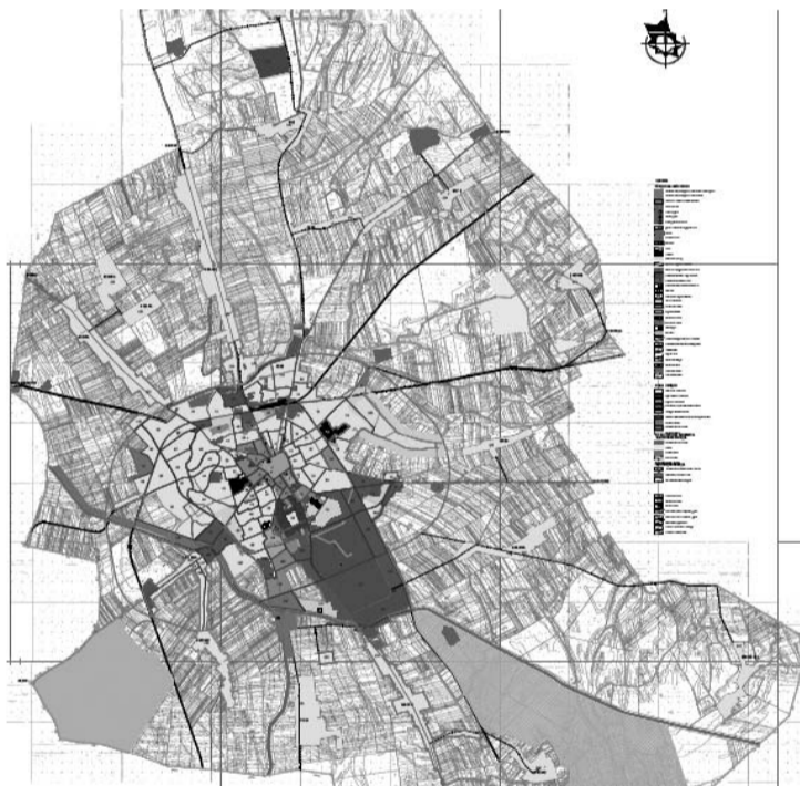
Мапа из Генералног плана града Сомбора

компаније “Војпут” о изградњи југозападног дела обилазнице од Стапарског до Апатинског пута. Радови су завршени последњих дана 2008. године, након што су “Путеви Србије” обезбедили средства за завршни слој