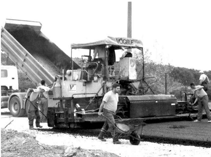
Ранији радови на делу обилазнице Стапарски – Апатински пут

Пројекат за северни део обилазнице, који повезује Бездански и Суботички пут, сачињен је још средином седамдесетих година прошлог