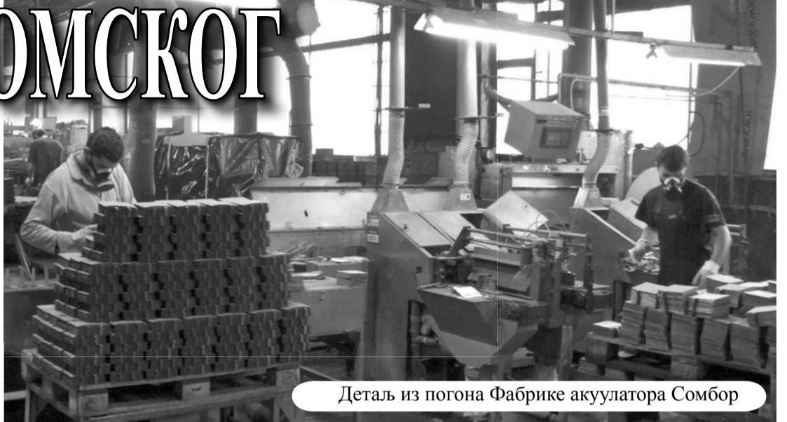
Детаљ из погона Фабрике акуулатора Сомбор

• Стручњаци предвиђају да ће инфлација у 2010. години бити око шест одсто и предвиђају да нам „неће бити горе уколико се наш међународни кредибилитет подигне и привуче инвеститоре“ • Ако, осим тога, и курс буде без већих осцилација, 2010. година могла би да буде година почетка економског опоравка