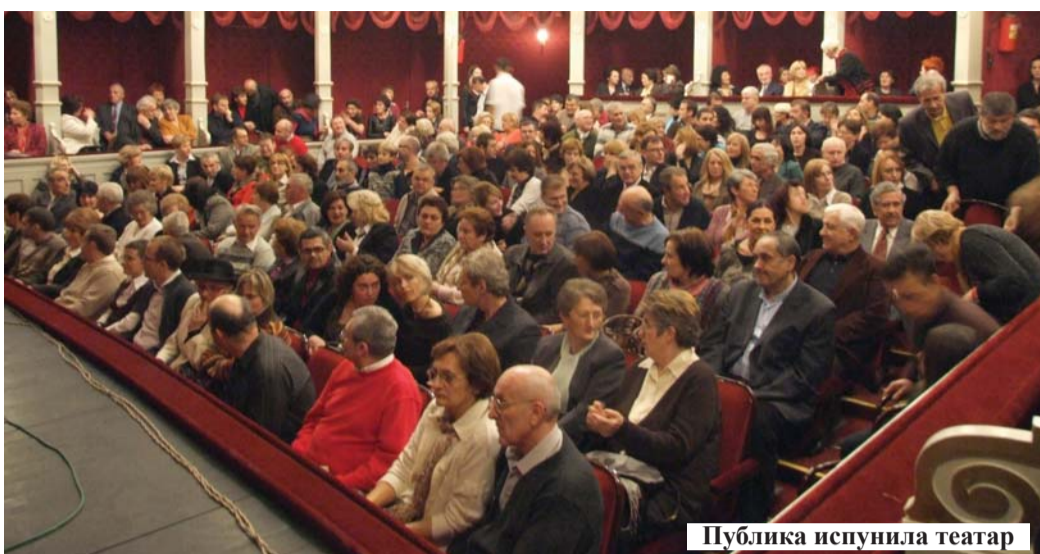
Публика испунила театар