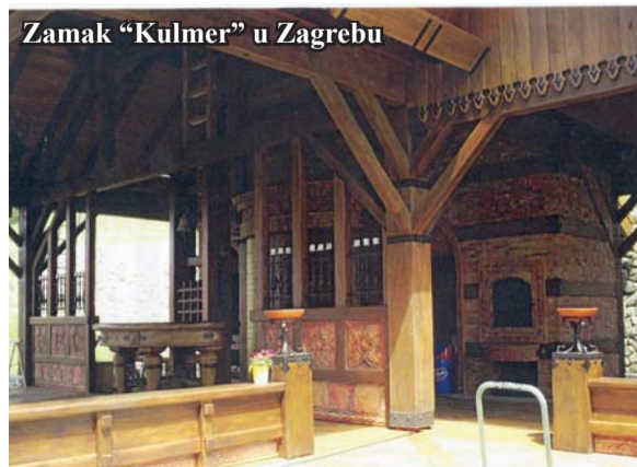
Zamak “Kulmer” u Zagrebu