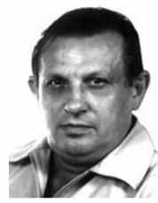
РАЈИ ВОДЕНИČАРУ из Etlingena u Nemačkoj

Vreme prolazi, ali uspomena na tebe ostaje zauvek u našim srcima.