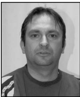
Zoran Obadić, fotograf