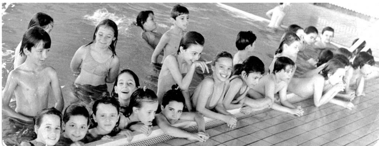
Četvrt veka obuke neplivača u Somboru