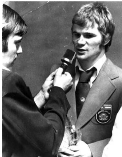
Prvi intervju „Somborskim novinama“ posle osvajanja olimpijske medalje u Montrealu

već davne 1983. godine. Prvi put u njoj je učestvovalo 1.010 učenika osnovnih škola somborske opštine. Za četvrt veka postojanja ovaj ambiciozni i nemerljivo koristan timski projekat je u tri navra-