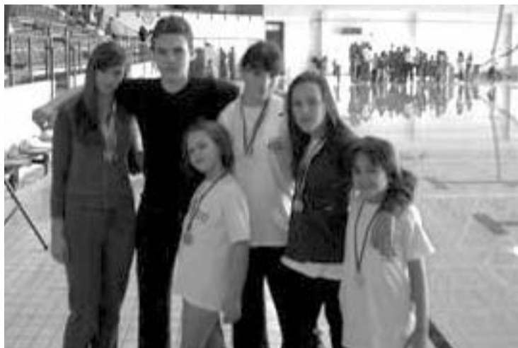
Пливачи ПВК Полет и поред немогућих услова за тренирање освојили су прегршт медаља

наступила су четири пливача и освојене су 3 медаље.