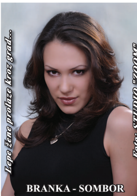
Lepe žene prolaze kroz grad...