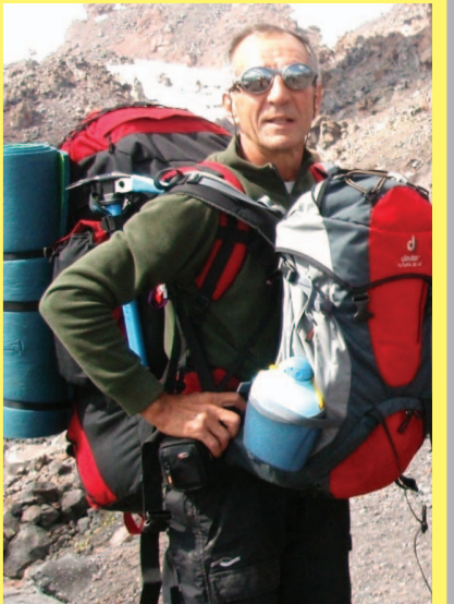
Na vrhu Evrope