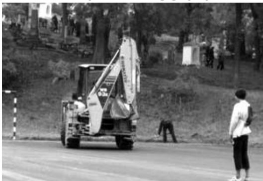
Školsko igralište presvučeno novim asfaltom

дова на parkiralistu kod crkve. Obezbedena su sredstva i sprovedene javne nabavke za rekonstrukciju centralnog grejanja i