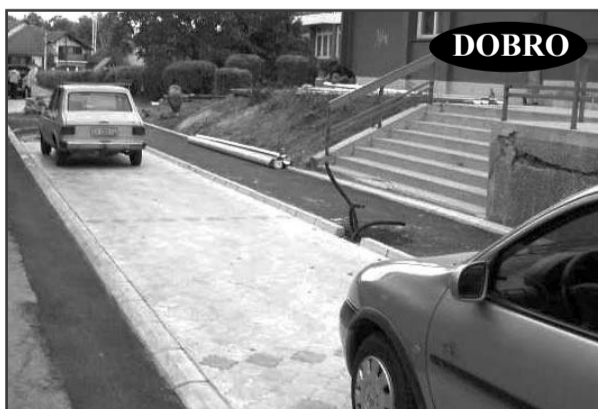
UREĐENO PRED VRTIĆEM

Javljajte nam se i dalje na telefone: 421-469 i 421-479 ili na e-mail adresu: so.somborske@neobee.net