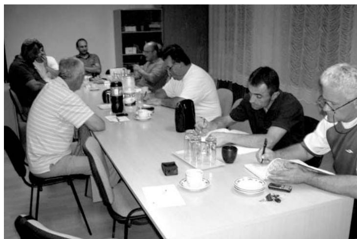
Sastanak Saveta MZ u Šantiću