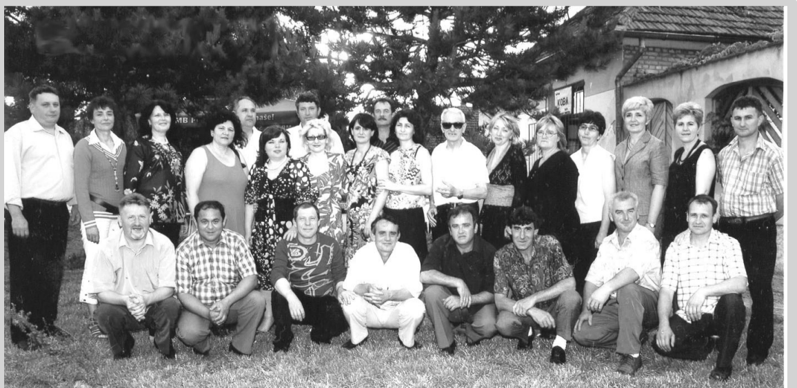
Jedan od tri razreda nekadašnjih monoštorskih malih maturanata