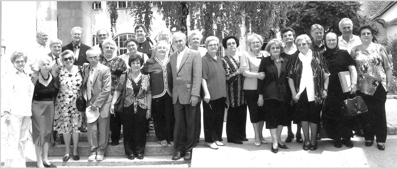
Прва генерација уписана у петогодишњу Учитељску школу