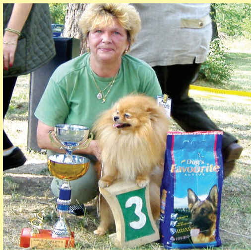
Rafael Nole Mirjane Živanović ponovo među najboljima