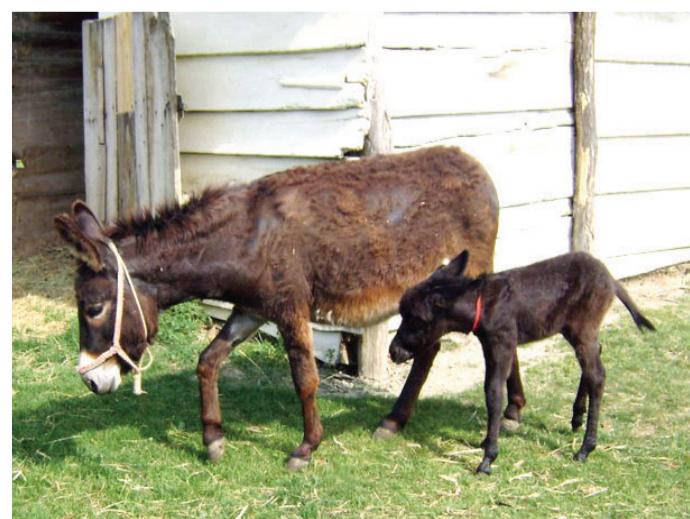
Mimoza srećna sa svojom prinovom