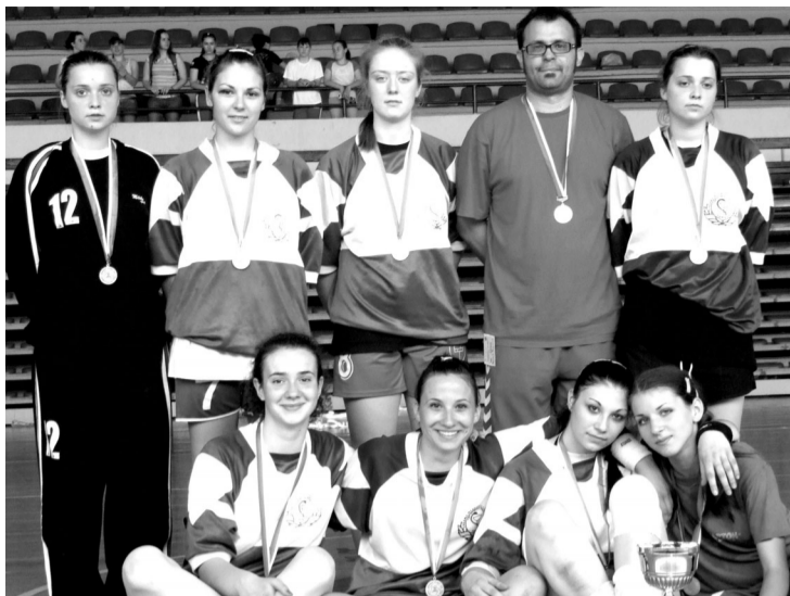
MŠ “Dr Rужица Rip” Сомбор