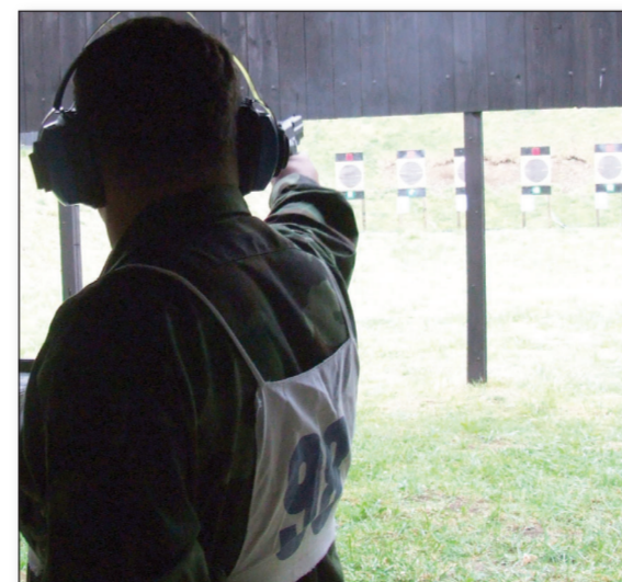
Oštro oko - jaki živci