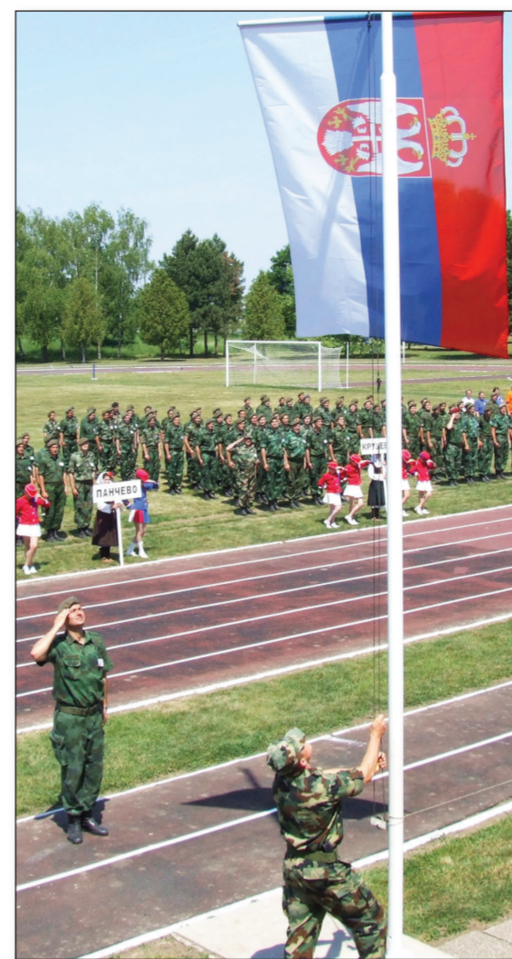
Svečano podizanje zastave