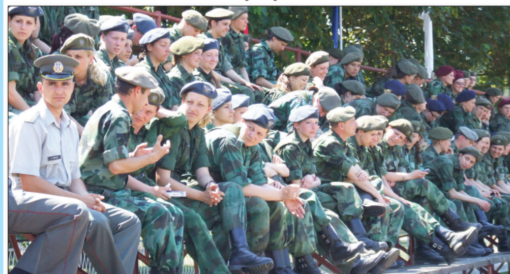
I publika u uniformama