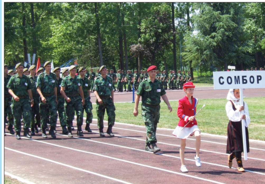
Svečani defile učesnika