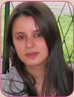
Piše: Maja Radmilo