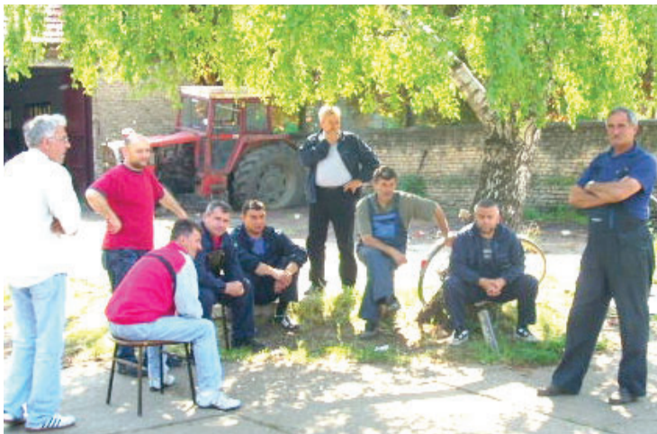
Запослени у кругу предузећа очекују нове преговоре