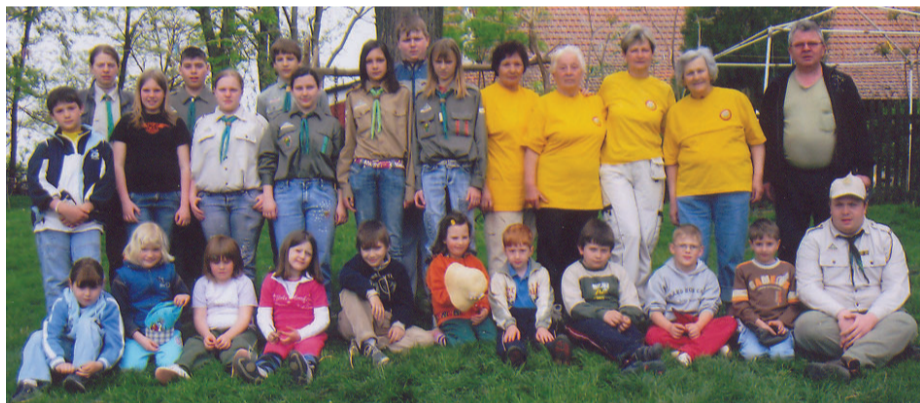
Сомборски планинари са децом из Савеза скаута војвођанских Мађара