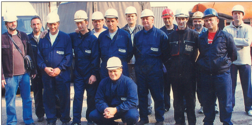
Док су други плановали, они су радили - радници сомборског "Оцачара" чистили су електрану у Костолцу

Одавно смо Празник рада престали да славио "ударнички", онако свечано, са јоргованом у прозорима, заставама и пароланама, парадама, наградама за прегалаштво и рекорде... Остала нам само навика првомајских уранака којих се ни ове године, у инат варљивом времену, ветру, киши и комарцима, многи нису одрекли. Зову природе, мирису роштиља и паприкаша,