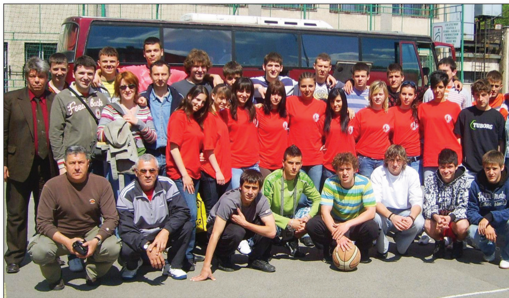
Ученици и професори Средње техничке школе у Кишкунхаласу