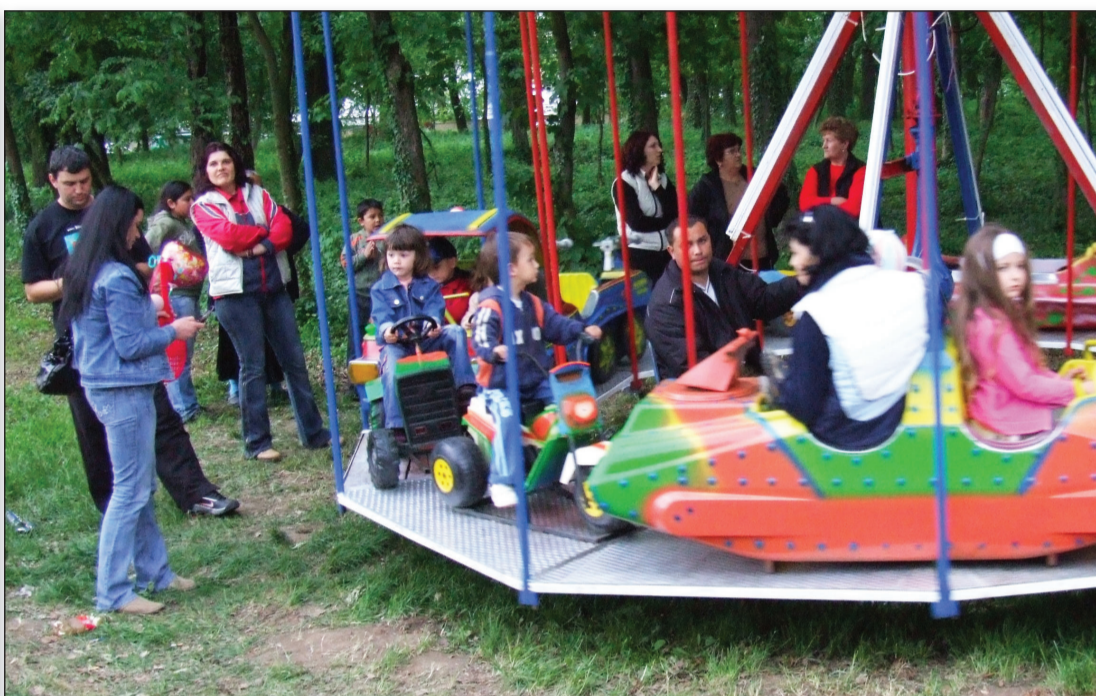
Шикара у знаку рингишипла