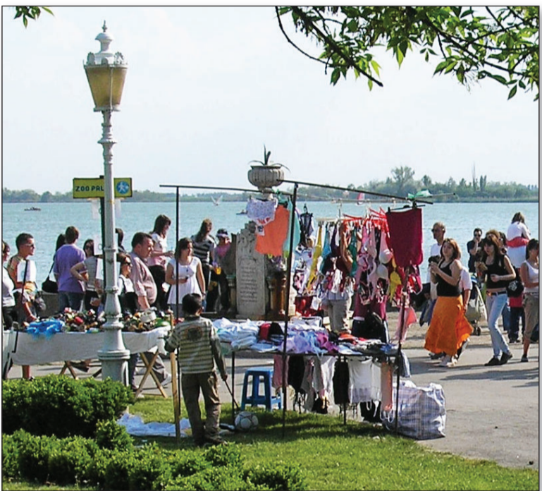
Многи Сомборци и ове године похрили су пут Палића