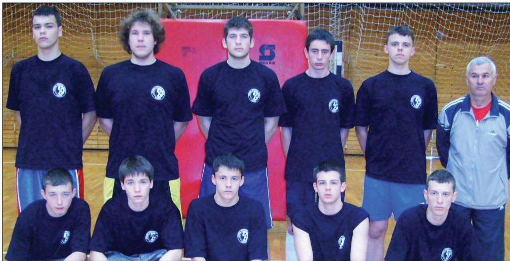
Победничка екипа у кошарци

Име и презиме _____ Адреса _____ Телефон _____ Бр. фискал. рачуна _____