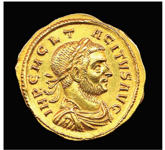
Zlatnik rimskog cara Tacita

У Сомбору и најужој околини пронађено је, крајем XIX и почетком XX века, више numizmatičkih nalaza, који сведоче о prisustvu raznih civilizacija, u rasponu od antičkog doba do kasnog srednjeg veka. Najstariji kovani novac pronađen je u ataru Gradine, a reč je o srebrnom grčkom novcu Dračke oblasti, kovanom na prelazu iz trećeg u drugi vek pre nove ere, koji su ovde, verovatno, doneli keltski trgovci. Keltski bakarni novac, kovan u prvom veku pre nove ere po uzoru na grčke tetradrahme, pronađen je u ataru Gradine, kao i na gradskom području, sa leve strane Bezdanskog puta, između Jevrejskog groblja i pruge, gde je u iskopanoj zemljanoj posudi otkriveno tridesetak keltskih bakrenjaka. Ratujući i trgujući sa Rimljanima ovdajšnji sarmatski stanovnici su tokom prvih vekova nove ere dolazili do rimskog novca, koji je pronađen u gradu i užoj okolini, a koji je kovan od polovine I do polovine IV veka nove ere. Pronađen je bronzi i srebrni novac rimskih careva: Vespazijana (vladao između 69. i 79. godine); Tita (79-81); Trajana (98-117), pronađen prilikom gradnje Srpske čitaonice 1882. godine; Hadrijana (117-138); Marka Aurelija (161-180); bronzana medalja cara Galenija (252-268), pronađena na kraju Batinske ulice; Aurelijana (270-275); zlatnik cara Tacita (275-276), naden na Vencu Petra Bojovića; bronzana medalja Valerije, supruge cara Galerija (293-311), pronađena u zemljanoj posudi u vinogradu kraj Sikare, te bakarni novčići careva Konstantina Velikog (306-337) i