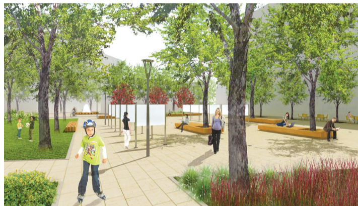
Награђено идејно решење Архitektonског ателјеа „Domus“

градског језгра Београда. Нeka од архitektonских решења „Domusa“ видљива су и